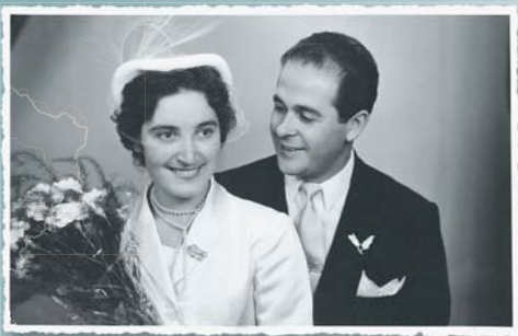
В день нашей свадьбы ▲

Моя дорогая жена рядом со мной уже 55 лет